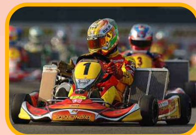
The number one is always difficult to keep !