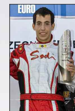
RG/MWC / ALEX SCHEIBERT