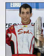
RGM/MC / ALEX SCHEIBERT