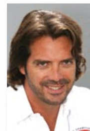
Président de SRO Motorsports Group