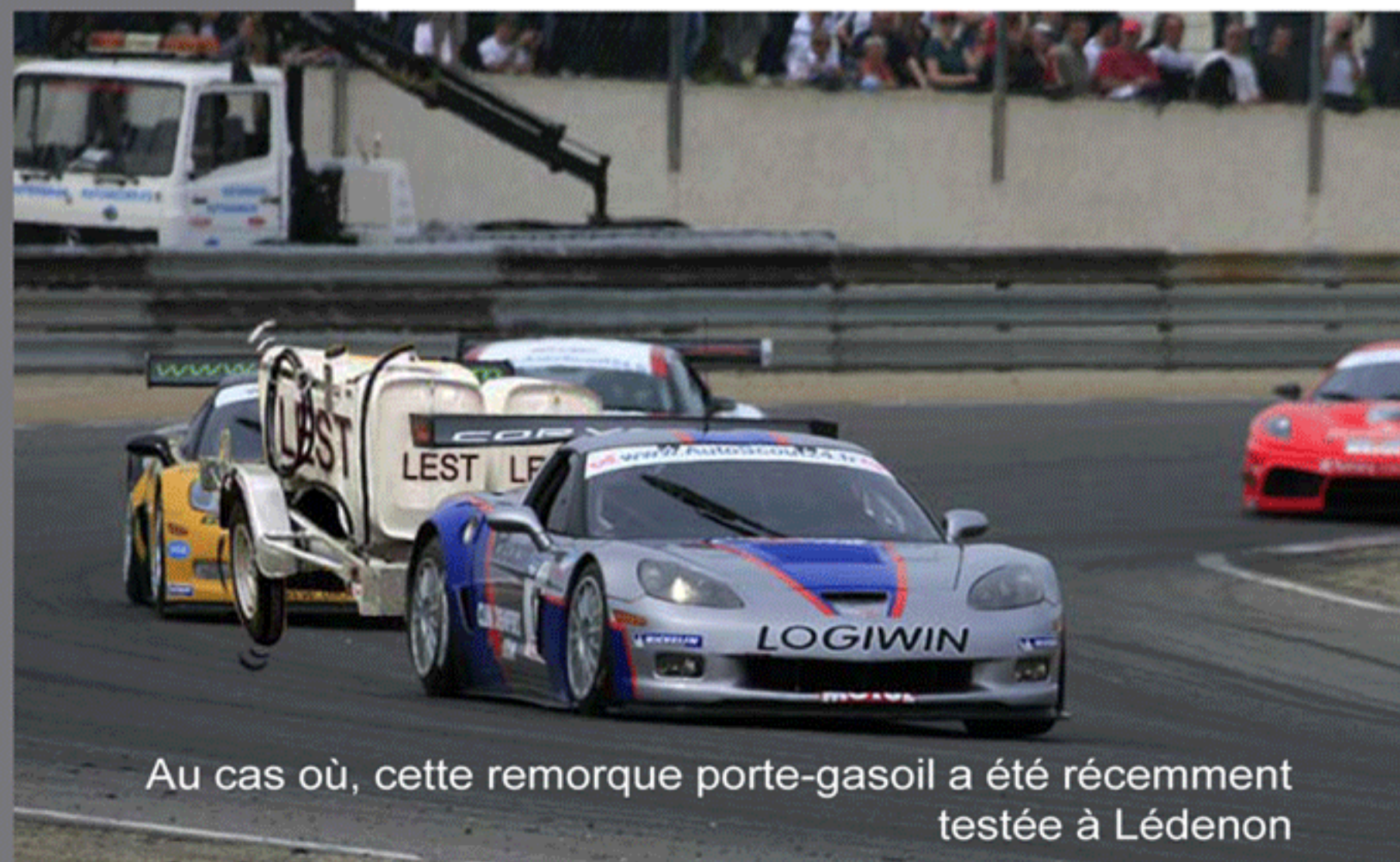
Au cas où, cette remorque porte-gasoil a été récemment testée à Lédénon